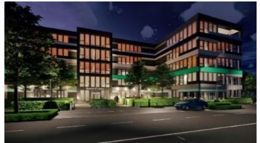
InnoHubs auf dem Skyline Hill in Würzburg

Einfach den Anmeldebogen ausfüllen und schon steht ihr auf der Liste!