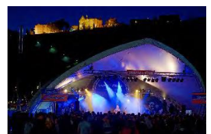
Illuminierte Bühne mit beleuchteter Steinburg im Hintergrund

Das Umsonst & Draussen wird liebevoll „Würzburger Woodstock“ genannt: An vier Tagen präsentiert die deutsche Musikszene ihr Können in einer ausgelassenen Open-Air-Atmosphäre bei freiem Eintritt. Es gibt nicht nur Konzerte auf mehreren Bühnen, sondern ein umfangreiches kulturelles Rahmen-programm. Selbstverständlich fehlen auch in diesem Jahr die abwechslungsreichen Verpflegungs- und Basarstände nicht.