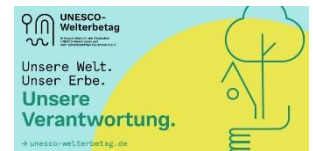
UNESCO-Welterbetag (Bild: UNESCO)

Von den 1.157 Welterbestätten liegen 51 in Deutschland. Aber wie können sie für kommende Generationen erhalten werden? Dazu zeigen bundesweite Sonderführungen, Ausstellungen und Infomärkte, was Welterbe eigentlich ist und was es so besonders macht. Eine Übersicht aller Veranstaltungen finden Sie im Veranstaltungskalender .