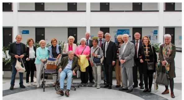
Teilnehmende des 60. Alumni-Treffens

Das 60. Treffen sollte nach Worten der Beteiligten aufgrund ihres Lebensalters und den damit verbundenen Einschränkungen die letzte gemeinsame Zusammenkunft in Würzburg sein. Die Wirtschaftswissenschaftliche Fakultät würde sich jedoch freuen, die Gäste auch im kommenden Jahr wieder begrüßen zu dürfen und bietet dafür gerne ihre Unterstützung an.