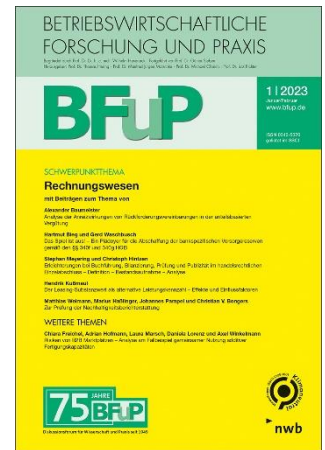
Cover BFuP Ausgabe 1/2023

Die Fertigungsindustrie muss sich durch den digitalen Wandel dynamisch und flexibel an die sich ständig ändernden Marktsituationen anpassen können. Um individuellen Kundenbedürfnissen sowie dem steigenden Kostendruck und dem wachsenden internationalen Wettbewerb entgegenzuwirken, setzen Unternehmen nicht mehr nur auf Einzellösungen. Durch interorganisatorische Zusammenarbeit auf einem Marktplatz für Produktionskapazitäten können sich Fertigungsunternehmen vor Produktionsausfällen absichern. Diese Studie untersucht, basierend auf einem Risikomanagementprozess, die Chancen und Risiken bei der gemeinsamen Nutzung additiver Fertigungskapazitäten auf einem Marktplatz. Zunächst werden operative, technische und netzwerkbezogene Risiken identifiziert. Auf der Grundlage von Experteninterviews können die identifizierten Risiken bewertet und der Wettbewerbsvorteil für produzierende Unternehmen durch interorganisatorische Vernetzung ermittelt werden.