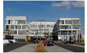
Inkubator des ZDI

Barcamps zeichnen sich dadurch aus, dass es kein festgelegtes Programm mit festen Sprechern gibt. Stattdessen sind alle Anwesenden aufgerufen, ihre Erfahrungen, ihr Wissen und ihre Ideen einzubringen. Häufig stellen dabei Dinge, die für uns selbstverständlich geworden sind, für andere anwesende Personen interessante Themen dar. Aus diesen Themen entsteht vor Ort spontan ein Programm. Dieses wird inhaltlich vollständig von den Teilnehmerinnen und Teilnehmern festgelegt. Die Erfahrung aus fünf Barcamp Würzburg sowie bei anderen Barcamps zeigen, dass dadurch ein sehr intensiver Wissensaustausch und tiefgründige Diskussionen entstehen.