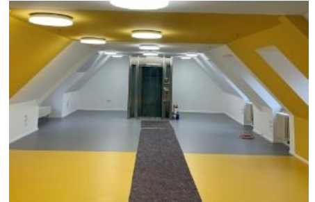
Level3 im Falkenhaus

Am 16.06.2023, also am bundesweiten Digitaltag, startet der erste Termin. Von 14:00 bis 18:00 Uhr können alle im dritten Stock in Level3 im Falkenhaus vorbeikommen und sich beraten lassen. Ab September wird es dann mit einem regelmäßigen Angebot weitergehen.