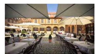
Bürgerspital Innenhof

10 Tage lang werden die feinen Weine des Bürgerspitals und köstliche Spezialitäten aus der Weinstubenküche im wunderschönen Innenhof serviert! Geselligkeit und Genuss treffen hier aufeinander und sorgen für die besondere Atmosphäre beim Hofschoppenfest des Bürgerspitals . Das Event Highlight ist die White-Party am 13. Juni. Im Innenhof des Bürgerspitals kommen auch dieses Jahr wieder Jung und Alt zusammen, um ganz in Weiß miteinander anzustoßen. Das absolute Highlight der Würzburger Weinfestsaison!