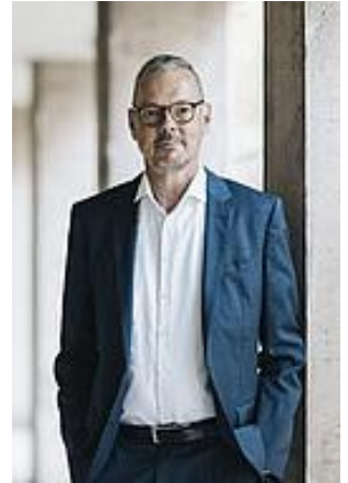
Prof. Dr. Peter Bofinger

Doch sollte man laut Prof. Bofinger die Probleme nicht nur auf Fehler der Vergangenheit oder exzessive Managerboni zurückführen, da die Bank ja unter Aufsicht und Überwachung der Eidgenössischen Finanzmarktaufsicht (FINMA) und der Schweizerischen Nationalbank (SNB) stand. Im Problemfall hätten diese Institutionen Maßnahmen einfordern müssen, doch in ihrem „ Bericht zur Finanzstabilität “ erklärte die SNB, dass sich die Kapitalsituation bei beiden Banken verbessert habe und auch die Ergebnisse des Stresstests waren positiv. Der Geschäftsbericht 2022 der CS wies ein Eigenkapital von 45 Milliarden Schweizer Franken aus und auch die Wirtschaftsprüfer bestätigten, dass alles in Ordnung sei. Wie ist ein so massiver Wertverlust zu erklären und was steckt hinter dem Zusammenbruch der CS? Lesen Sie Prof. Bofingers Antworten im Artikel der gemeinsamen Veröffentlichung von Social Europe und dem IPG-Journal .