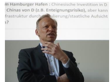
Prof. Dr. Dr. h.c. Clemens Fuest

Im Fazit sieht er vor allem in fünf Bereichen großen Reformbedarf, der jedoch mit hohen Ausgaben und geringen öffentlichen Einnahmen einhergeht: 1. Neue Sicherheitspolitische Herausforderungen, 2. Klimaschutz/Klimawandel, 3. Demografischer Wandel, 4. Digitalisierung und 5. Infrastrukturerneuerungen. Die jährlichen Ausgaben für diese Transformationen werden auf etwa 300 Mrd. Euro geschätzt. Ausführlichere Informationen finden Sie in dem entsprechenden Artikel im ifo Schnelldienst .